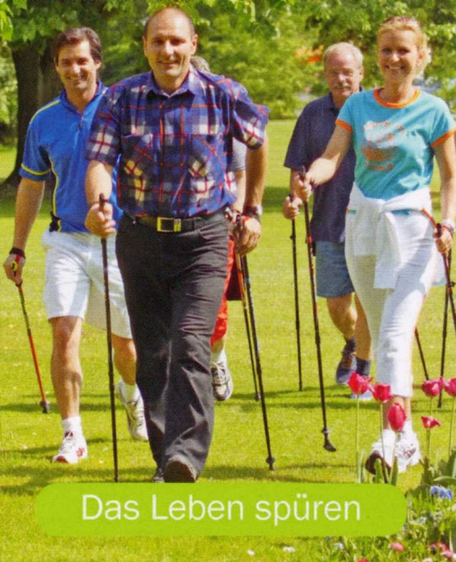
Das Leben spüren